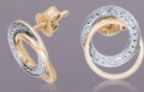
Z16-05 / E Earrings / Náušnice 10,890 CZK