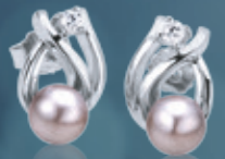
Z16-35 / E