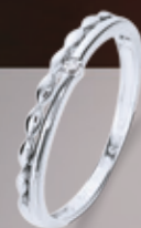
Z16-12 / R