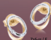
Z16-11 / E