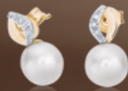
Z16-15 / E Earrings / Náušnice 11 290 CZK