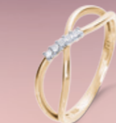
Z16-07 / R