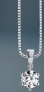
Z16-19 / P Pendant / Přívěs 3 460 CZK