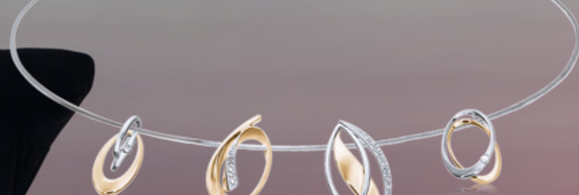
Z16-08 / P