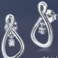
Z16-51 / E