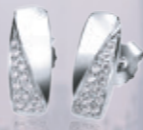
Z16-25 / E Earrings / Náušnice 1 340 CZK