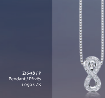
Z16-58 / P

rhodiované stříbrné šperky s kubickým zirkonem rhodium-plated silver jewelry with cubic zirconia