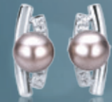
Z16-36 / E