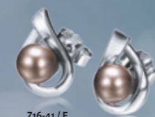
Z16-41 / E