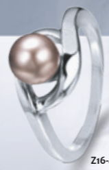
Z16-41 / R