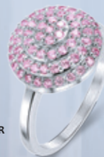
Z16-26 / R