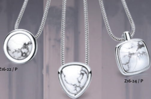
Z16-22 / P