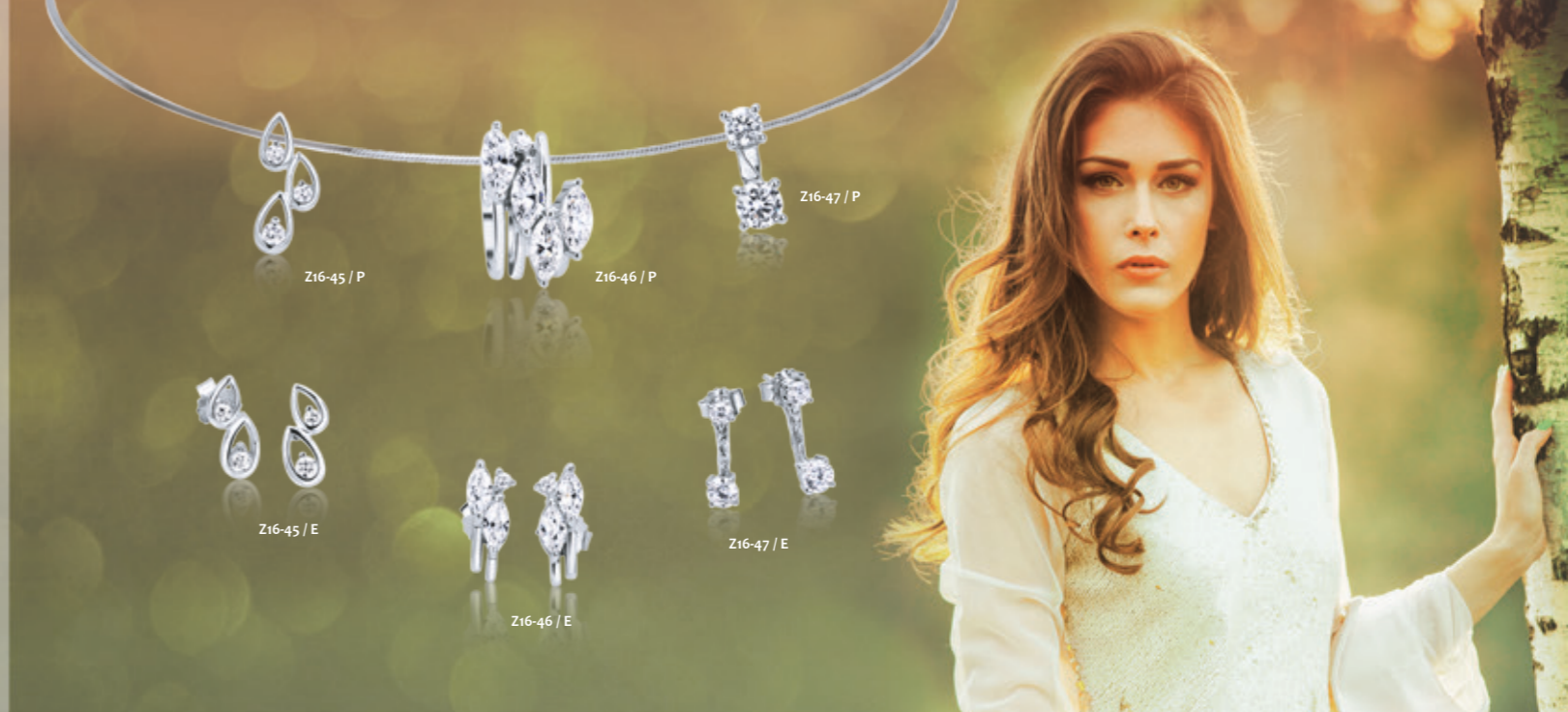
Z16-45 / P