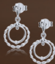
Z16-12 / E