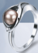
Z16-40 / R