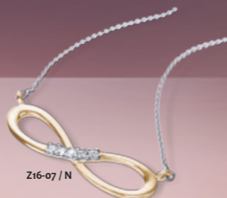
Z16-07 / N