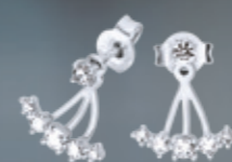
Z16-21 / E Earrings / Náušnice 8 260 CZK