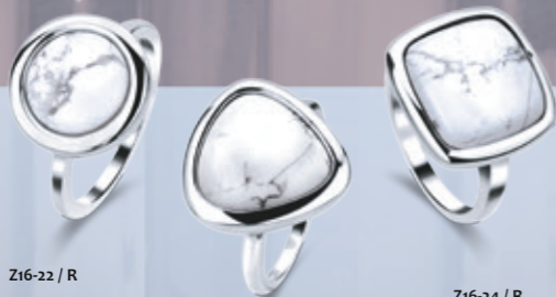
Z16-22 / R