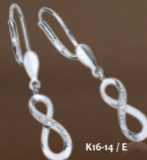
K16-14 / E