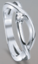
Z16-51 / R