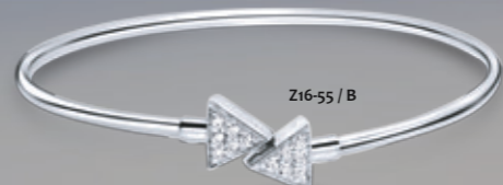
Z16-55 / B