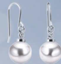
Z16-38 / R