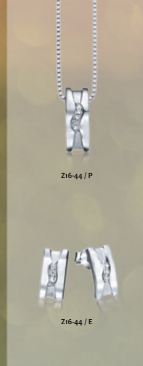
Z16-44 / P