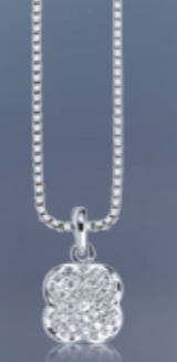
Z16-52 / P