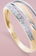
Z16-10 / R