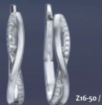
Z16-50 / E