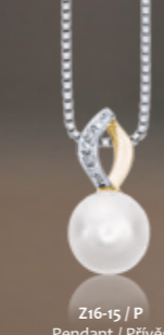
Z16-15 / P Pendant / Přívěs 10 640 CZK

šperky z 14k zlata s diamanty a perlami 14k gold jewelry with diamonds and pearls