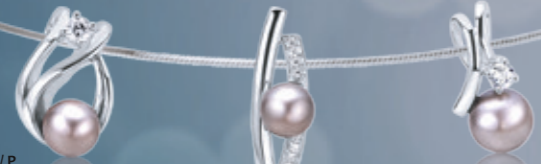
Z16-37 / P