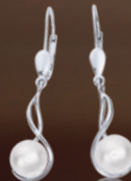
Z16-13 / E