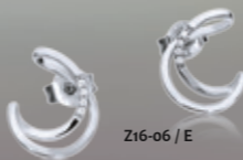
Z16-06 / E