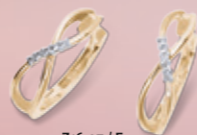
Z16-07 / E