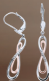
Z16-16 / E Earrings / Náušnice 22 260 CZK