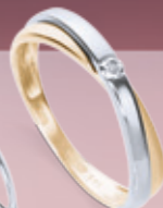
Z16-11 / R