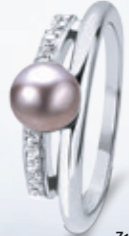
Z16-37 / R