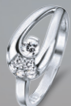
Z16-49 / R