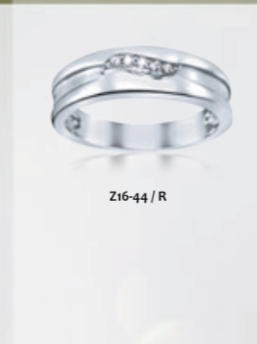
Z16-44 / R