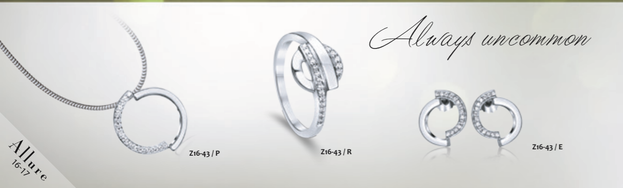
Z16-43 / P