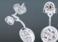
Z16-18 / E Earrings / Náušnice 10 860 CZK