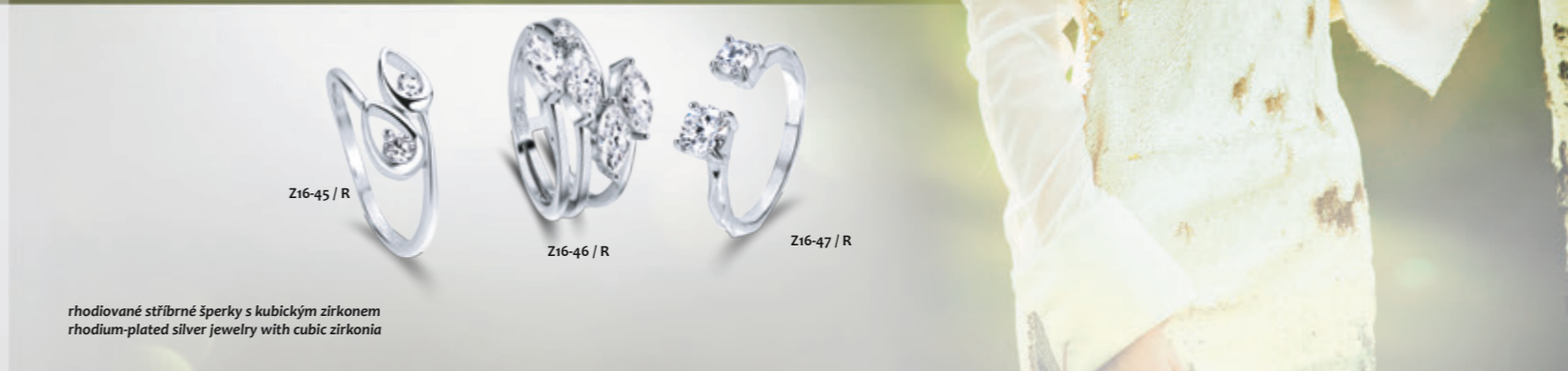
Z16-45 / R