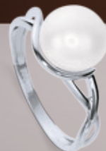
Z16-13 / R