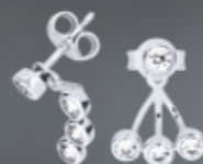
Z16-20 / E Earrings / Náušnice 9 580 CZK