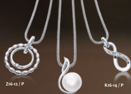
Z16-12 / P