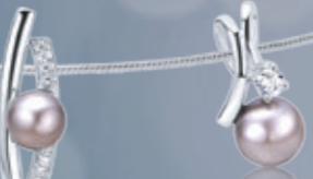
Z16-36 / P