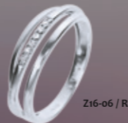
Z16-06 / R