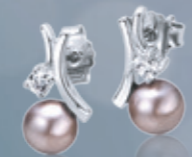
Z16-37 / E