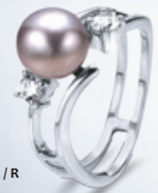
Z16-36 / R