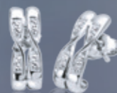
Z16-48 / E