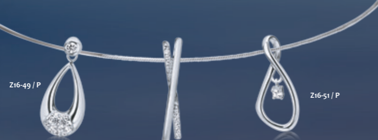
Z16-49 / P

rhodiované stříbrné šperky s kubickým zirkonem rhodium-plated silver jewelry with cubic zirconia