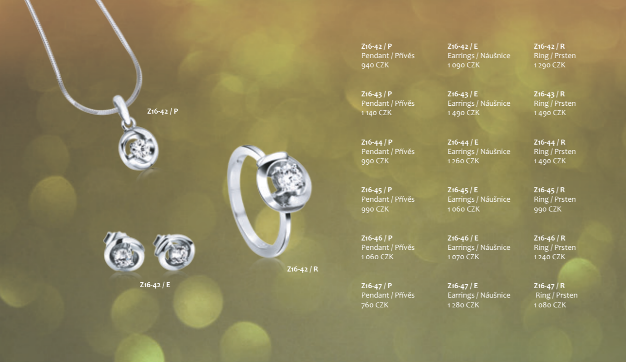
Z16-42 / P Pendant / Přívěs 940 CZK