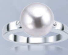
Z16-39 / P