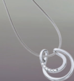
Z16-06 / P