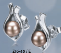
Z16-40 / E