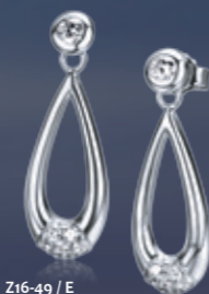
Z16-49 / E