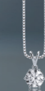
Z16-17 / P Pendant / Přívěs 3 340 CZK