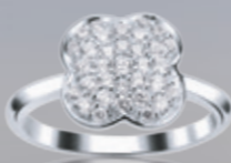
Z16-52 / R