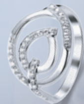
Z16-27 / R

rhodiované stříbrné šperky s kubickým zirkonem rhodium-plated silver jewelry with cubic zirconia