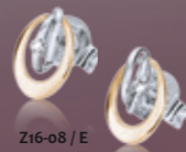
Z16-08 / E