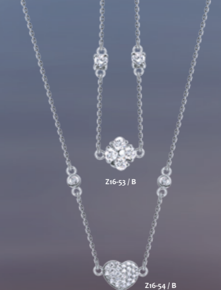
Z16-53 / B