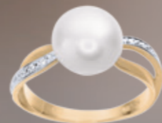
Z16-15 / R Ring / Prsten 18 870 CZK