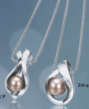
Z16-41 / P