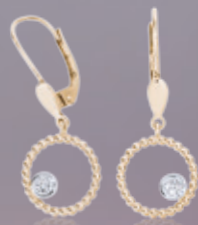
Z16-03 / E Earrings / Náušnice 14,460 CZK